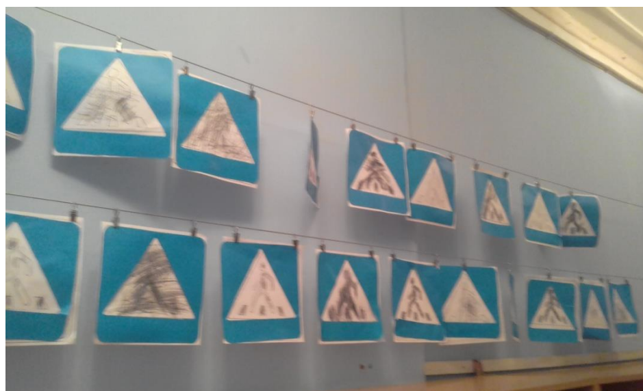
Аппликация с элементами рисования «Пешеходный переход»