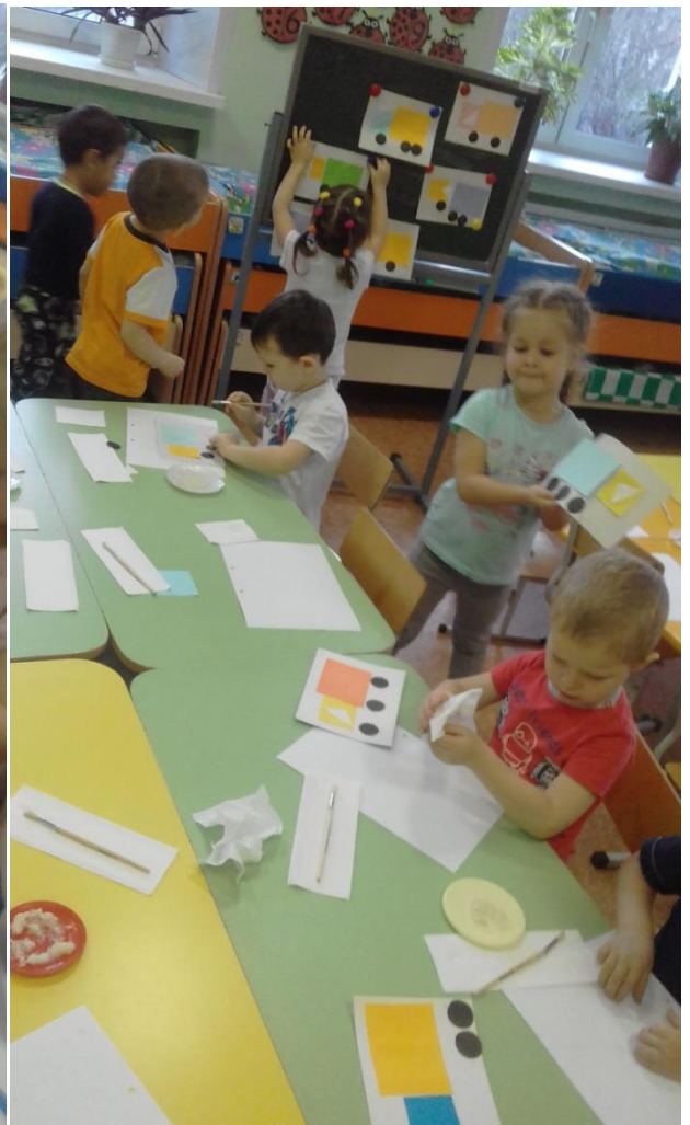
Аппликация «Железная дорога», «Грузовики»