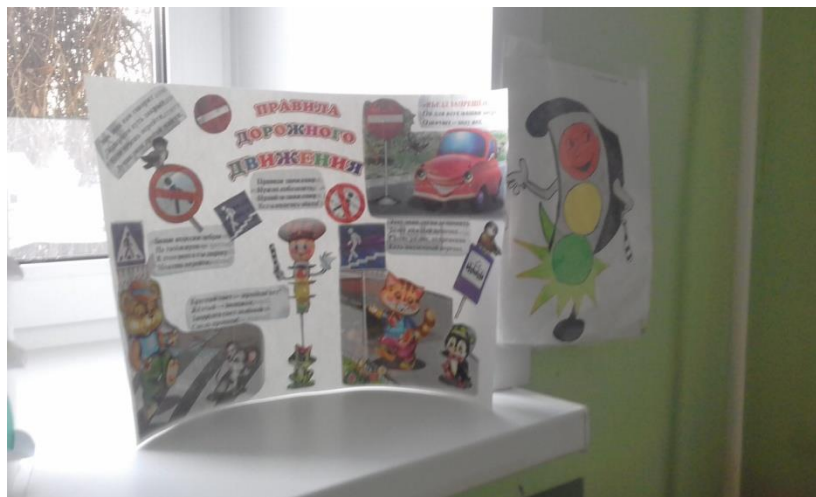
Атрибуты в уголок ПДД.