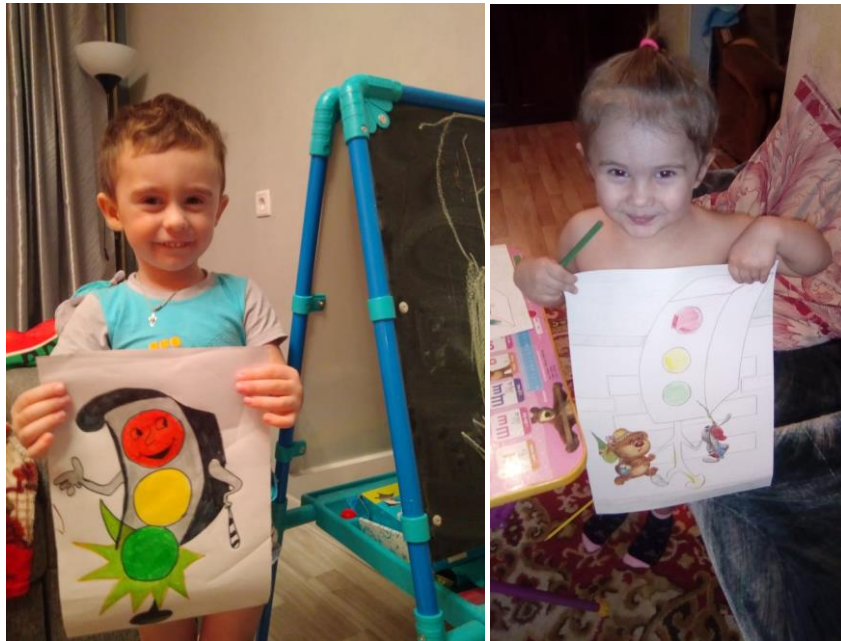
Домашняя работа «Светофор»